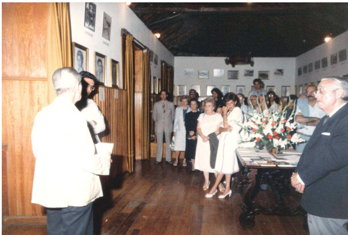
Inauguración de la “ Exposición de güimareros ilustres, fotos antiguas y libros sobre Güimar ” (1986).